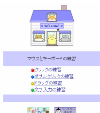
《マウスとキーボードの練習》