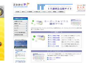
《IT講習会支援サイト》