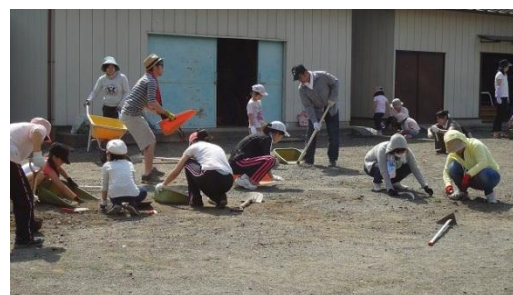
校庭整備（体育小屋前の砂利の除去）