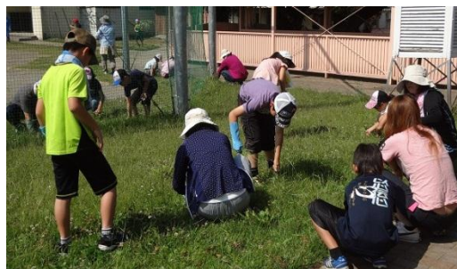
校庭の除草（バックネット周辺の芝生）