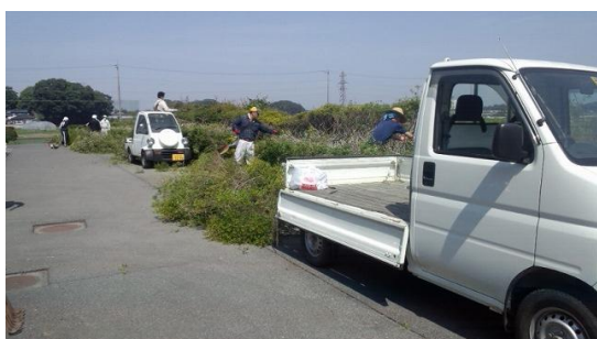
ドウダンの刈り込み（おやじクラブ）