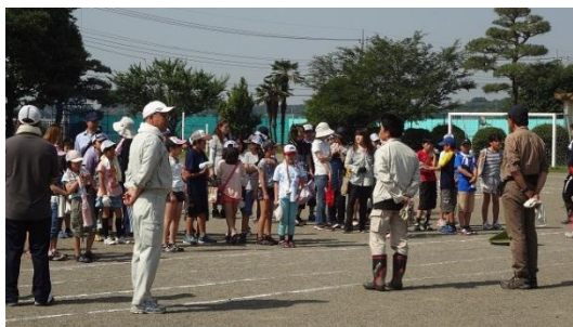
第1回校庭整備作業に集まったみなさん

日差しが強く、大変暑い日でしたが、大人も子どもも汗まみれ土まみれになりながらも、一生懸命作業をし、とてもきれいな校庭がよみがえりました。