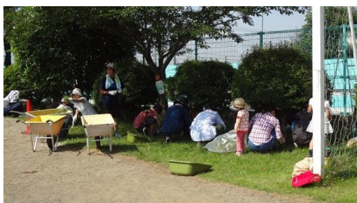
校庭の除草（プール東側の芝生）