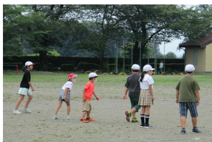
縦割り班 共遊の時間