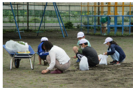
全校除草！雨上がりは除草日よりです。