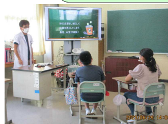
飲酒・喫煙についての学習