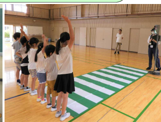
右・左・右、手を上げて横断