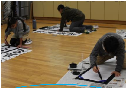
「挑む」 書道に挑戦（卒業式に掲示）

以上のような内容です。さっそく、目標に向かって挑む姿が見られます。一人一人が有言実行している瞬間を見つけて、励ましていきたいと思っています。（下の写真は1月中にとらえた瞬間） ※「」＝めあて