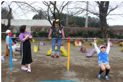
「鉄棒に挑戦」 新しい技への挑戦