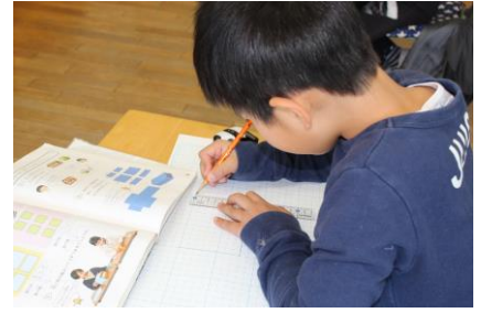
「字をていねいに書こう！」 文字も形も一生懸命。