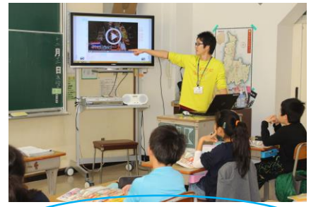
「真剣な授業態度」 集中して勉強！