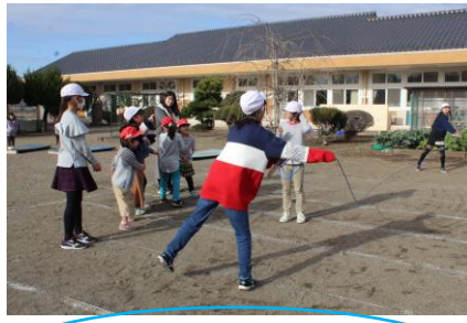
「もっと外で遊ぶ！」 6年生と1年生が長縄遊び