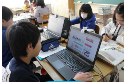
「頑張ってる勉強」 6年生になる前に！