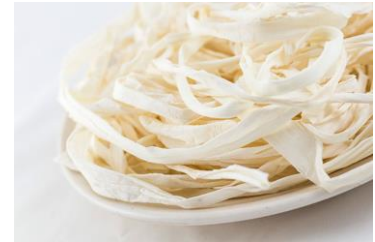
ほしたあとのかんぴょう