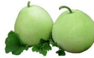
かんぴょうの実「ふくべ」

下野市はかんぴょうの生産が日本一です。かんぴょうは、かんぴょうの実である「ふくべ」を細長くむいて乾燥させたものです。6日(月)と15日(水)、31日(金)の給食には下野市産のかんぴょうが使われます。ぜひ味わって食べてみてください。