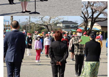
6年生代表児童 歓迎のことば