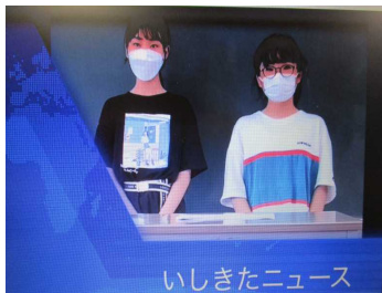
メディアコントロールウィーク動画