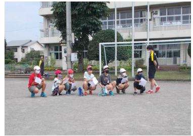
学校行事の放送準備