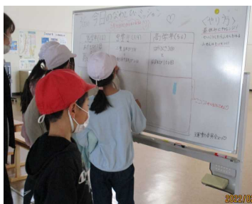
なわとびチャレンジ