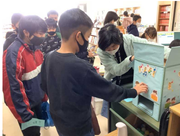
ガチャポンイベント