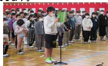
児童代表歓迎のこたば 代表児童