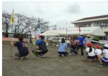
(保護者の皆様による審判係活動)