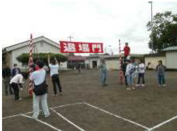
(早朝の保護者の皆様による準備)

西小は、保護者の皆様と地域の皆様に支えられた「おらがまちの学校」であることを再認識いたしました。ありがとうございました。今後もよろしくお願いいたします。