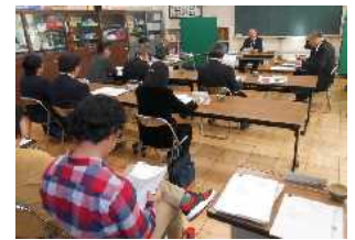
教育委員会議の様子