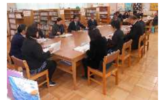
教職員との懇談の様子