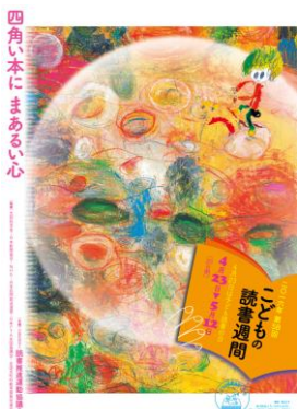
四角い本にまあるい心

こ 子どもにもっと ほん 本を！の ねが 願いから、 ねん 1959年 しょうわ (昭和34年) ねん に はじ 始まりました。 ことし 今年 どくしょしゅうかん の ひょうご こども読書週間の しかく 標語は、 ほん 「四角い本に こころ まあるい心」です。 ほん 本 よ を読むと、 あたたかく あたたかく、 こころ まあるい心 こころ になりますね。 ほん たくさんの本 であ に出会える こころ といいですね。