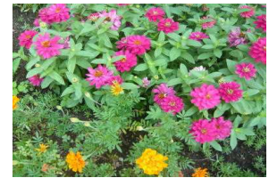
ジニアとマリーゴールド