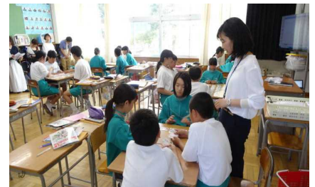
授業参観 学び合い