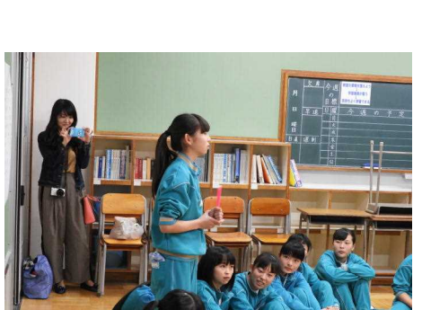
生徒の表情からもうれしさが伝わってきます。