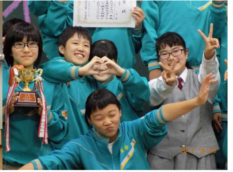
各学級で記念写真を撮りました。