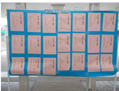
生徒の標語 代表作品

1月27日(月)から31日(金)まで、学校給食週間です。給食の意義を知り感謝の気持ちを持ち、食についての興味・関心を高めることを目的に設定されています。生徒全員が食に関する標語を作成し、代表作品を昇降口に掲示しました。昼の放送では、給食委員によるクイズが出され、いろいろと知ることができます。また、先週は、各県の郷土料理が出され、おいしくいただきました。