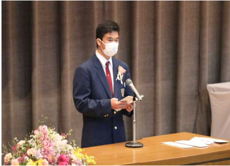
答辞 〇〇 〇〇さん

3月10日(火)、令和元年度 第59回南河内中学校卒業式が挙行されました。下野市長様には大変お忙しい中ご臨席いただき、お祝いの言葉をいただきありがとうございました。今年には在校生が参加できず大変残念で少し寂しい式典にはなりましたが、卒業生は真剣な態度で立派に式に臨むことができました。生徒会長の〇〇 〇〇さんは、「この南河内中を卒業できることに誇りを持ち、力強く新たな道へと歩み始めます。」という決意と周囲の方への感謝の言葉、後輩への期待を述べました。65名の卒業生の今後の活躍に期待しています。