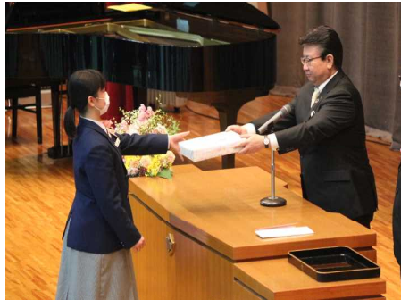
記念品贈呈 〇〇 〇〇さん