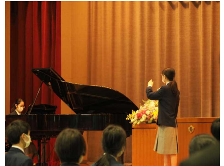
指揮 〇〇 〇〇さん、伴奏 〇〇 〇〇さん