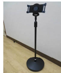
タブレットスタンド