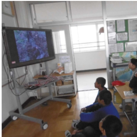
【児童生徒に考えさせる場面】