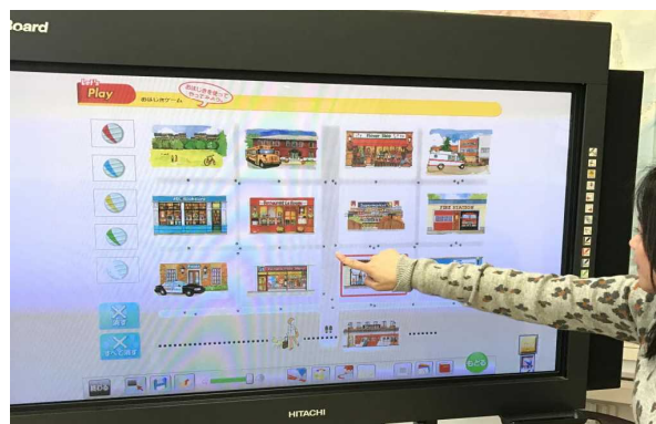
【実演でやり方を示す場面】