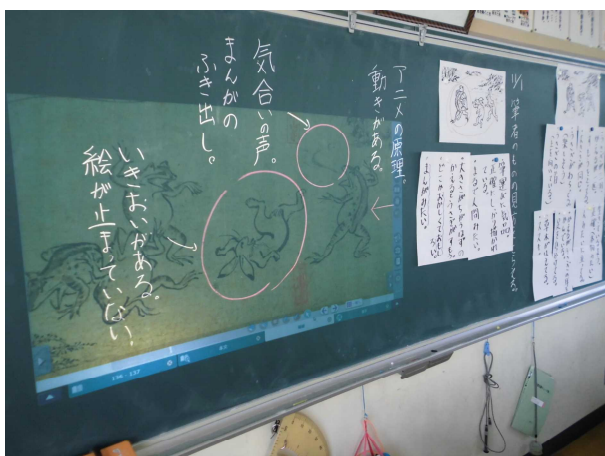
【わかりやすく説明する場面】

本年度、小学校には電子黒板機能内蔵型プロジェクターが導入された。また中学校にはディスプレイとタブレット PC のセットが導入された。「教育の情報化」が進む現代においては、これら電子黒板等の活用の機会や場を増やし、よりわかりやすい授業を展開していくことが必要であると考えられる。電子黒板等を活用した研修を行うとともに、授業実践を行い、その事例を紹介することで、先生方の日々の教育活動の一助になればと考え研究内容に設定した。