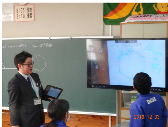
【児童生徒が発表する場面】