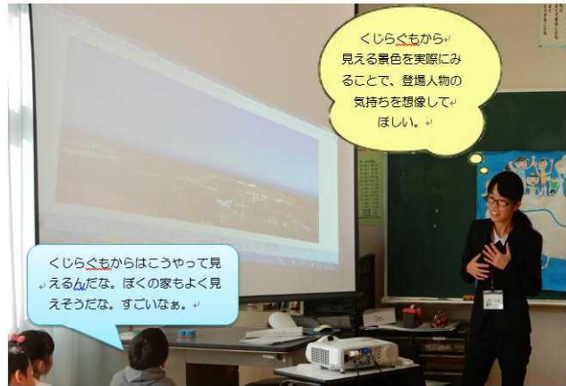
【興味・関心を高める場面】