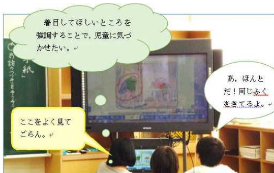
【明確に伝える場面】