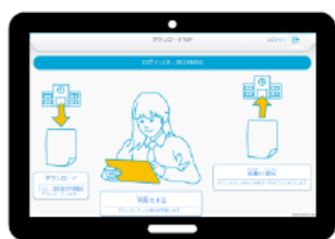
① 学校でダウンロード