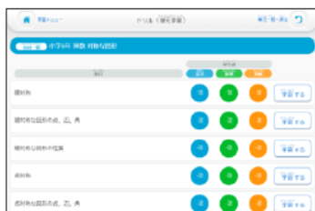
② オフラインで学習