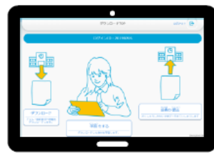
③ 学校で成績の提出