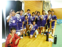
<女子ハンドボール部>