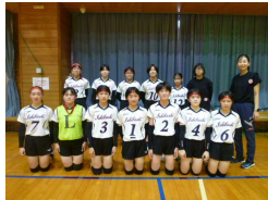
<女子バレーボール部>