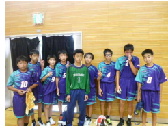
<男子ハンドボール部>