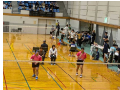
<女子バドミントン部>