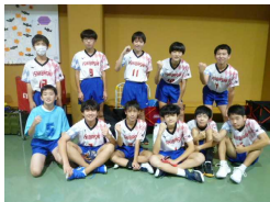
<男子バレーボール部>