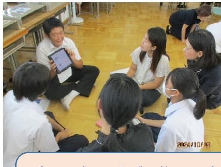
グループで一人ずつ英語のプレゼンテーションをした後、ALT の先生方からの質問にも答えました。