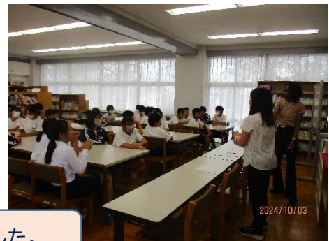
昼休みは学年ごとにクイズタイムを楽しみました。

ALT の先生方からは「知らない日本文化をたくさん知ることができて楽しい時間を過ごすことができました」と感想をいただきました。これからも積極的に英語を話し、コミュニケーション力を高めていきましょう。