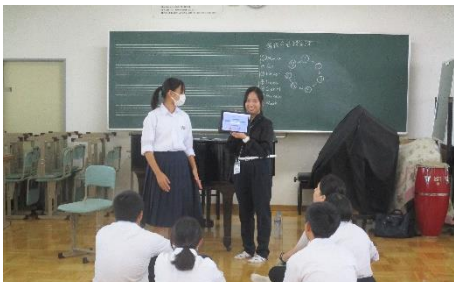
授業の最後には代表の生徒がプレゼンテーションを行いました。