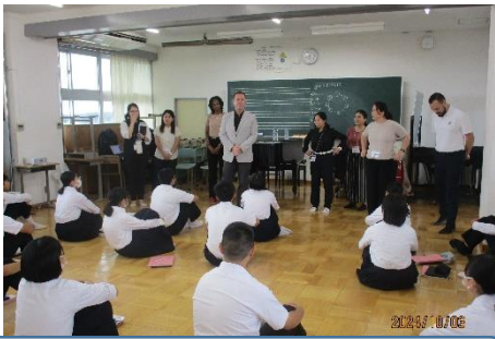
市内の小中学校に勤務している ALT の先生方7名が来校しました。

10月3日(木)市内の ALT7名が本校に来校されました。英語によるコミュニケーション活動を3年生の全クラスで1時間ずつ実施するとともに、昼休みには学年ごとにクイズタイムを楽しむなど、英語があふれる一日になりました。