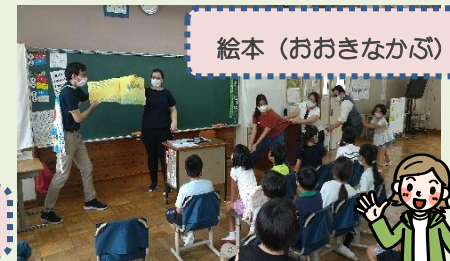
絵本(おおきなかぶ)

2年生のクラスでは、複数のALTによる読み聞かせを行いました。三匹のこぶた、おおきなかぶ など、子どもたちが知っている話であったこともあり、ALTと一緒に劇をしながら楽しむことができました。