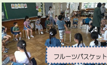
フルーツバスケット