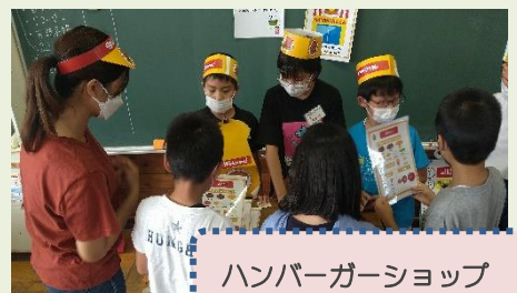
ハンバーガーショップ