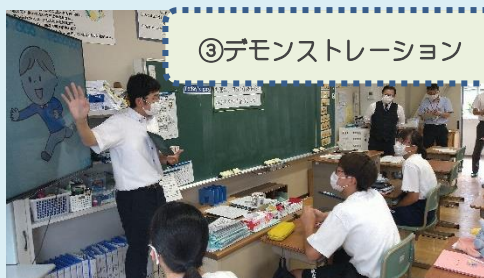
③デモンストレーション

授業の流れ ①Small Talk → ②ねらいの確認 → ③デモンストレーション → ④ペア活動1回目 → ⑤中間の振り返り → ⑥ペア活動2回目 → ⑦発表 → ⑧振り返り